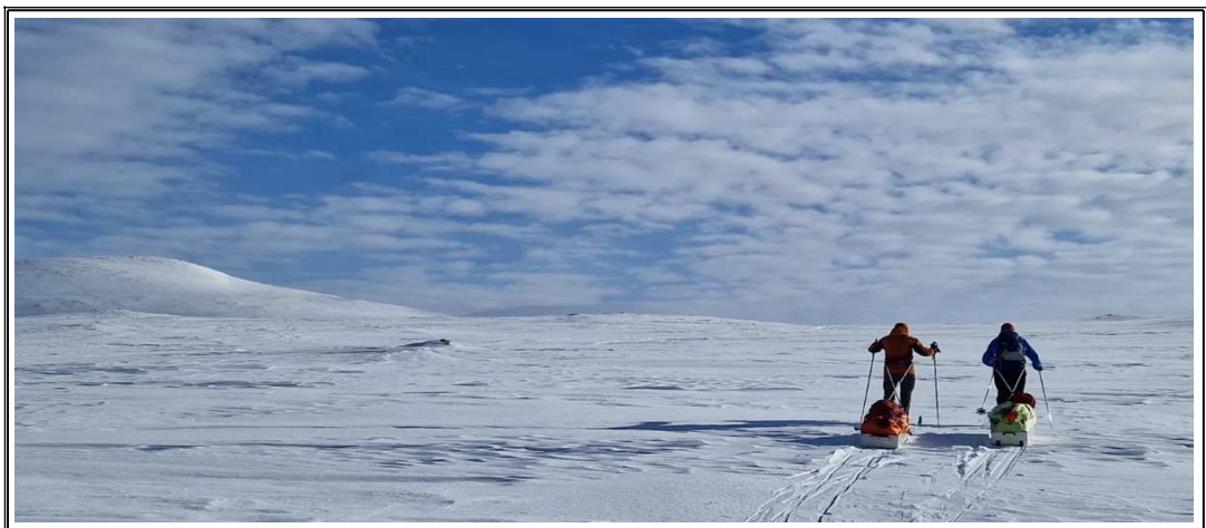
Kuva Käsivarren tuntureilta: Hanna K