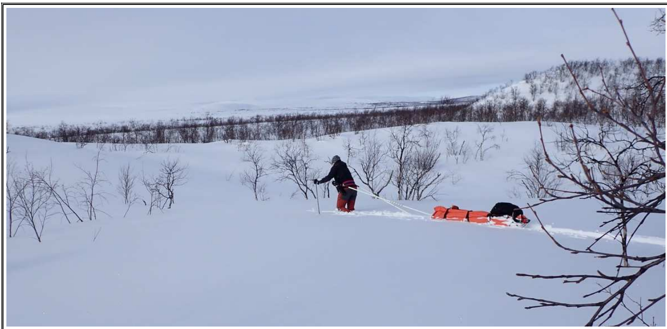
Kuva Huh, huh, todellista umpihankivaellusta Käsivarressa, Hanna K