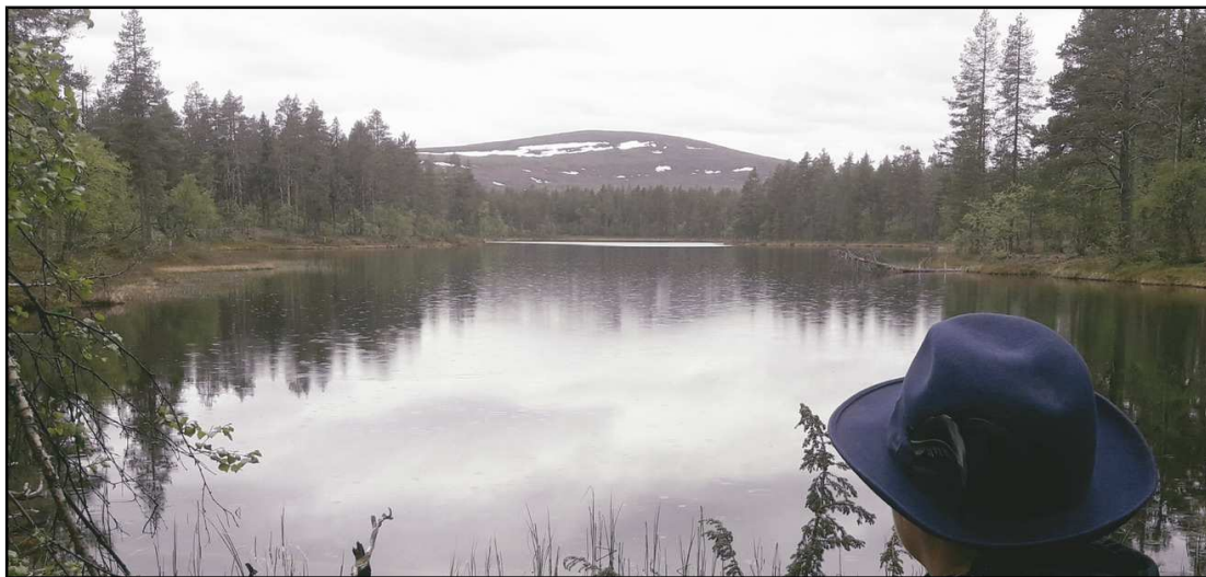
Pitkäjärvi ja Lumikero Enontekiöllä - kuva Rko

Alueeseen voit tutustua www.luontoon.fi/evo