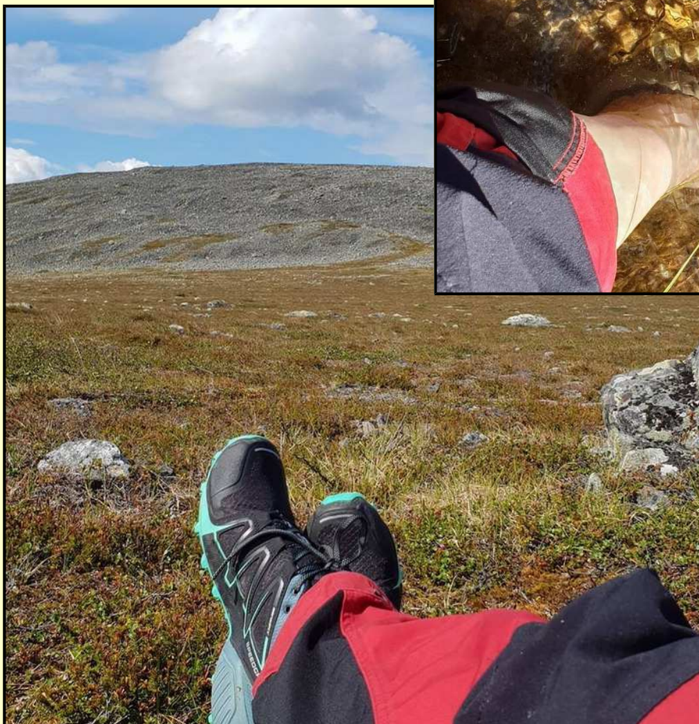
Vaellusjalat tauolla