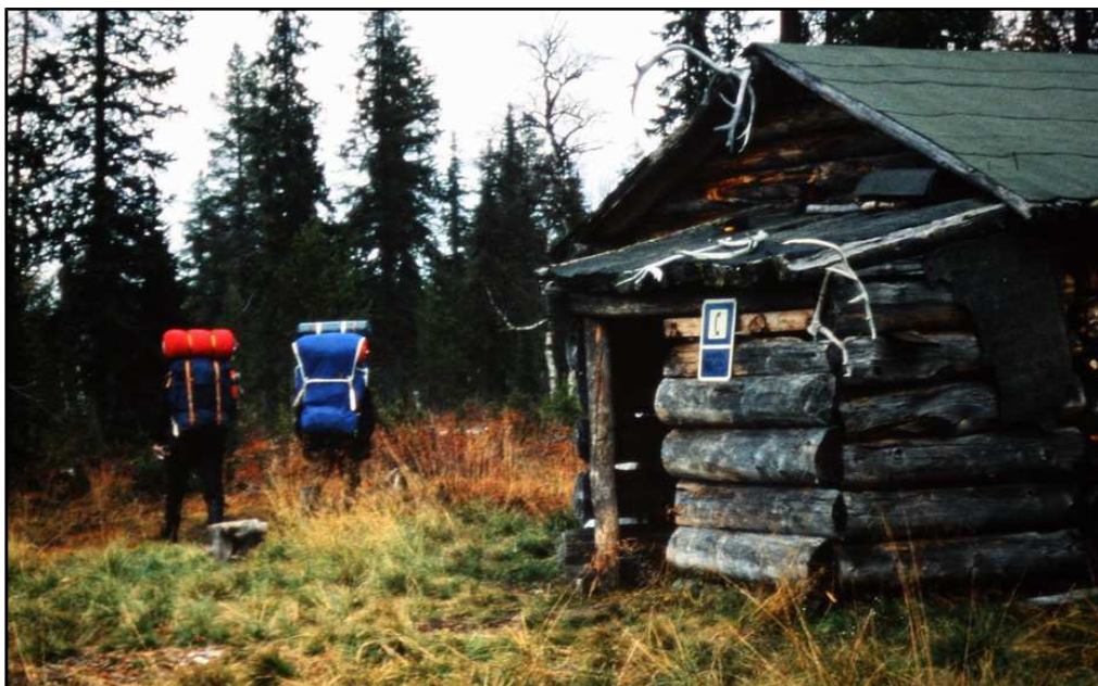
Vaelluksella Kemihaarasta Kiilopäälle 1983

Ilmoittaudu pikaisesti 0400-939 690 tai terhi.k.koivisto(at)gmail.com