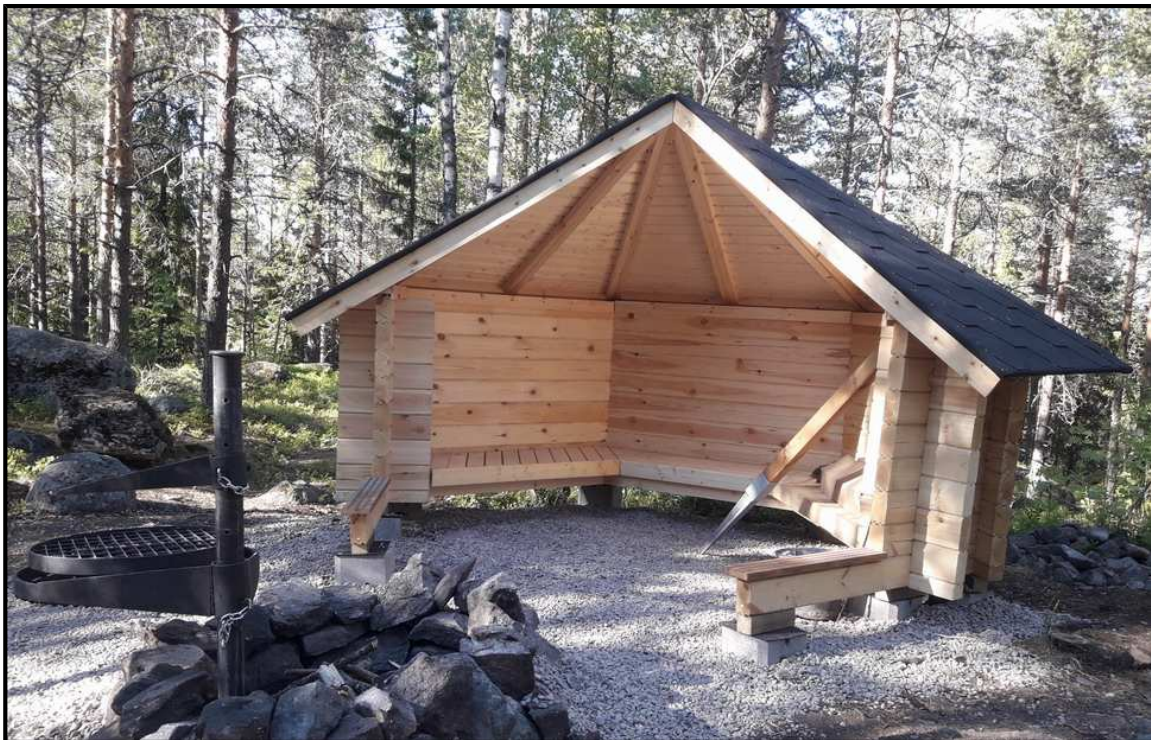
Marttalaavu Tiirismaalla

Reitti on verrattain vaativa, eikä sovellu liikuntarajoitteiselle eikä aivan pienille lapsille.