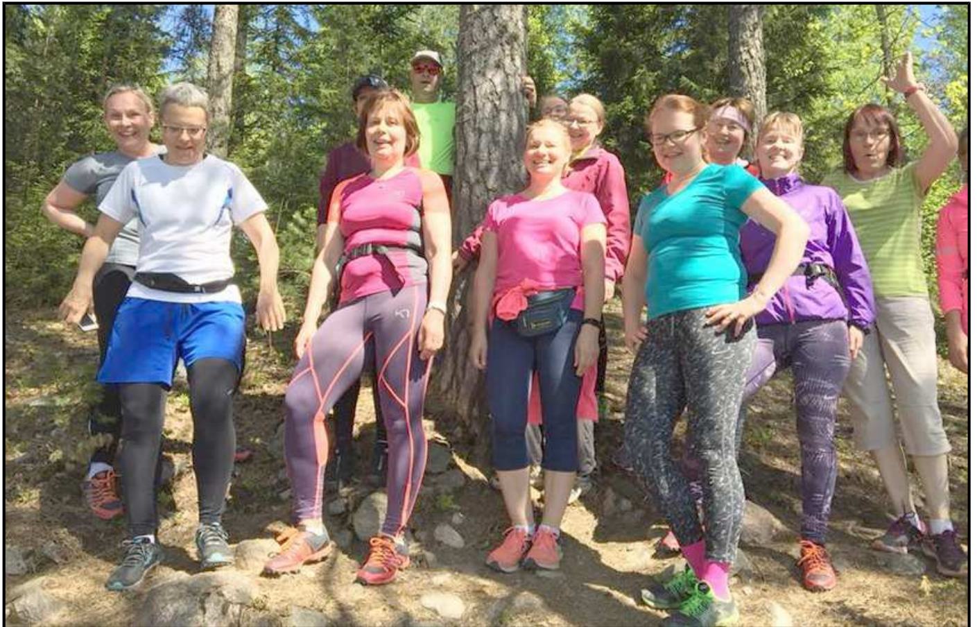
Polkujuoksijat Hollolan maastossa