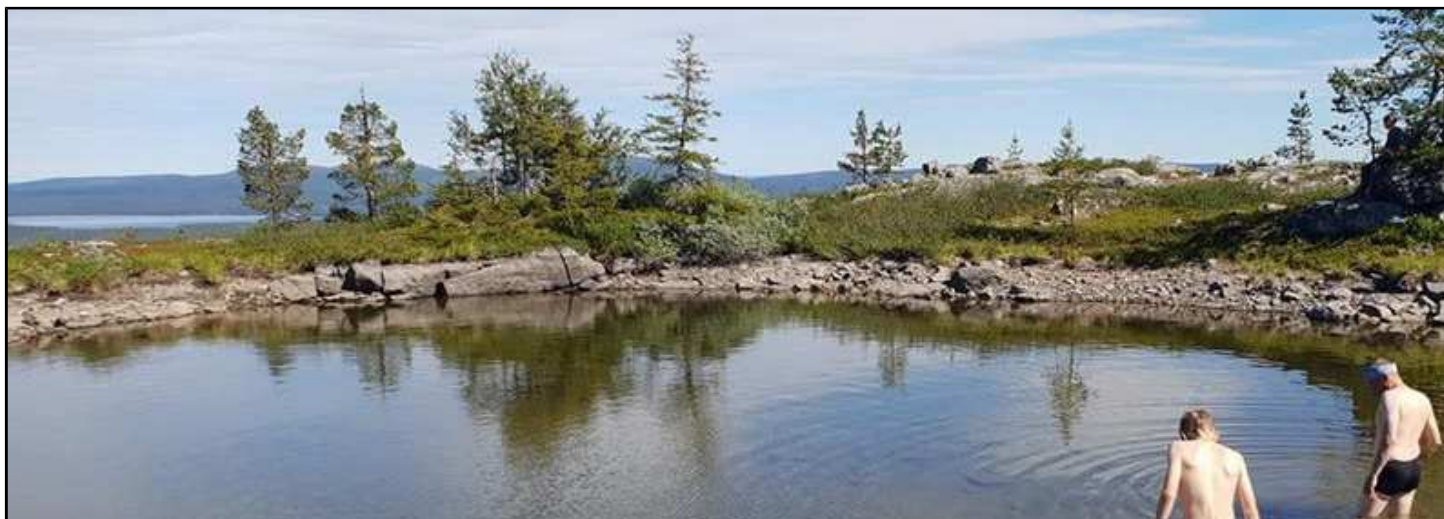
Suomen komein maauimala Särkitunturilla

Kiisan voit saada myös PDF:tiedostona sähköpostiisi. Sinun täytyy vain ilmoittaa Suomen Ladun jäsenrekisteriin, että haluat jäsenyhdistyksen tiedotteet vain sähköisenä.