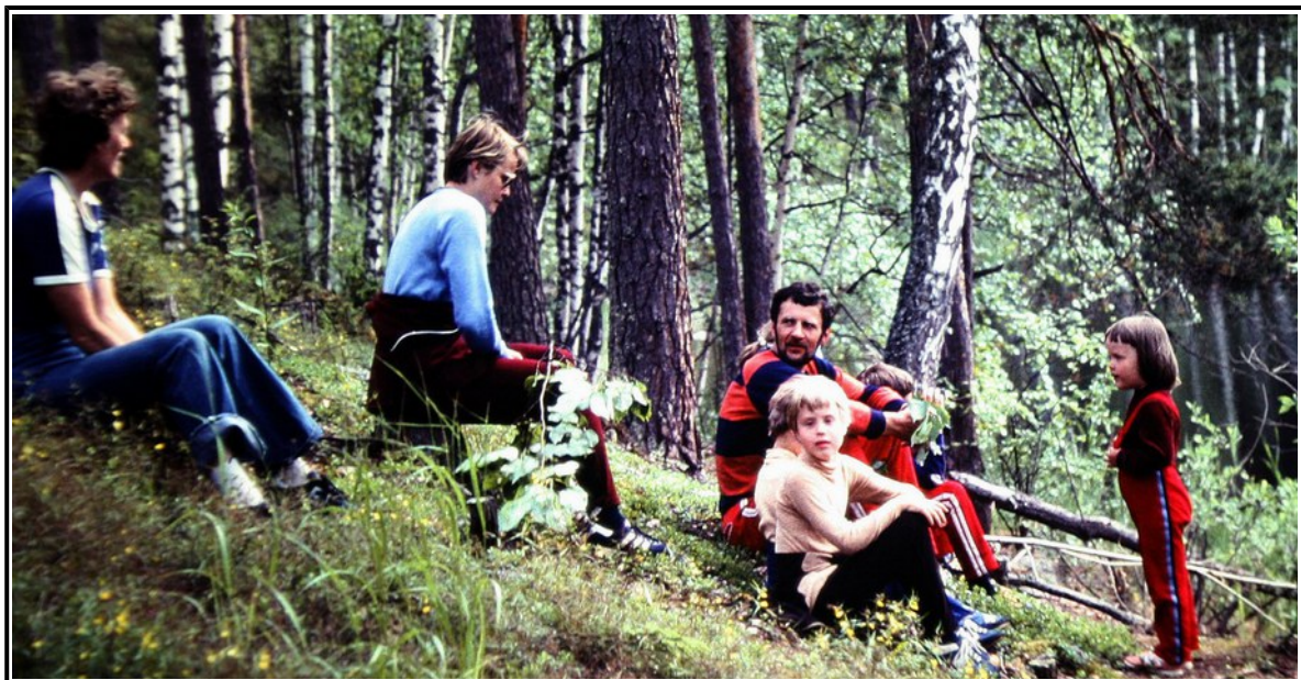
Yläkuva: Leiripäivät Hollolassa 1987 Alakuva: Saariretkellä Kelventellä