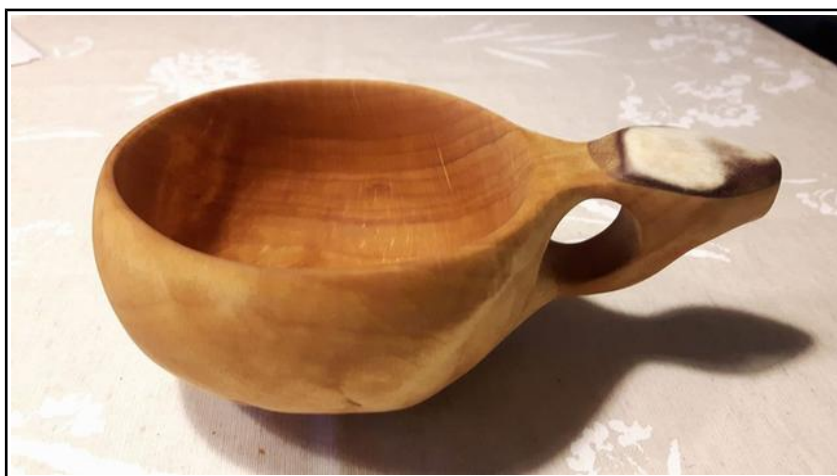
Hannan kuksa ( oma valmiste )