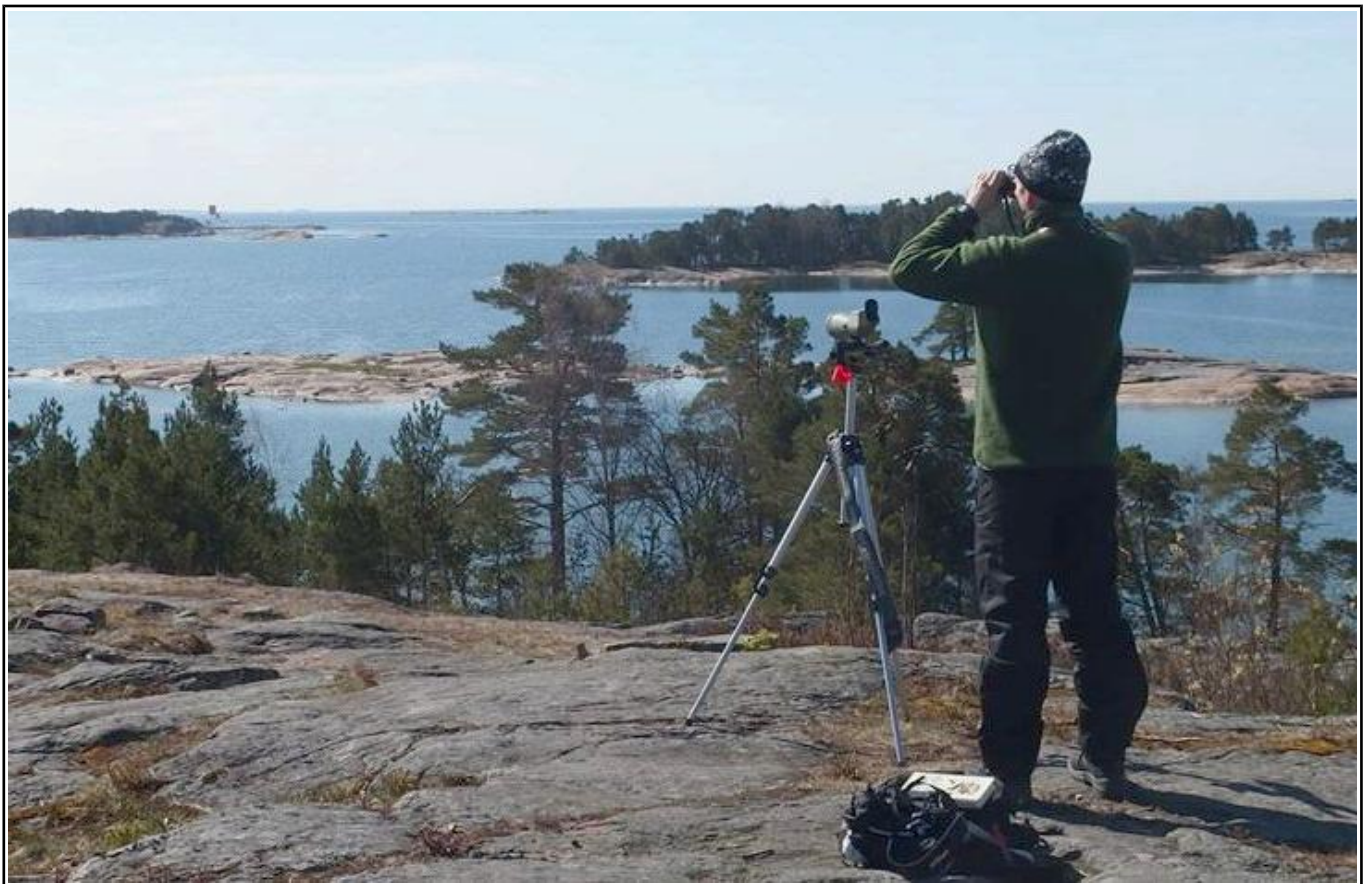
Merilintujen bongausta.

Lintujenkatselulavalta palaamme toista reittiä Myllykieppiin. Kävelymatkaa tulee yhteensä vajaat 4 km. Sen jälkeen tulistelemme majan pihalaavulla, missä lintuopas vielä kertoilee lintuharrastamisesta ja voimme tarkkailla myös majan pihalintuja. Tervetuloa mukaan kaikki luonnosta kiinnostuneet! Tapahtuma sopii myös perheille: kävely on pääosin pikkutietä ja halutessaan osan kävelymatkasta voi siirtyä autollakin. Uudet jäsenet ja kaikki muutkin, tervetuloa samalla tutustumaan Myllykiepin majaamme! Jäsenet voivat vuokrata mökkiä edullisesti myös omaan käyttöön. Halutessasi voit tulla osallistumaan myös pelkkään nuotioiltaan.