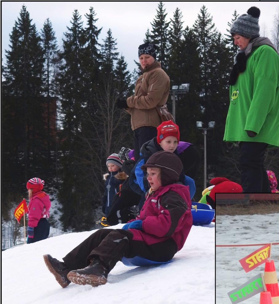
Pulkkamäki olisi vaatinut lisää lunta