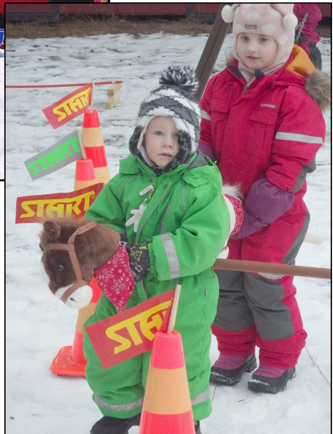
Keppihevosella täyttä laukkaa