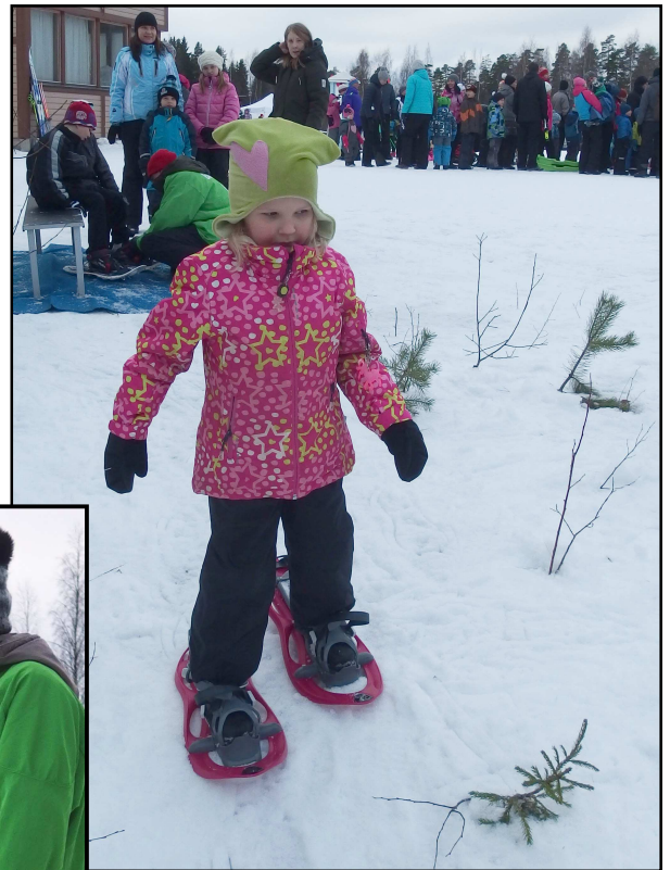
Lumikenkäilijä karhun jäljille