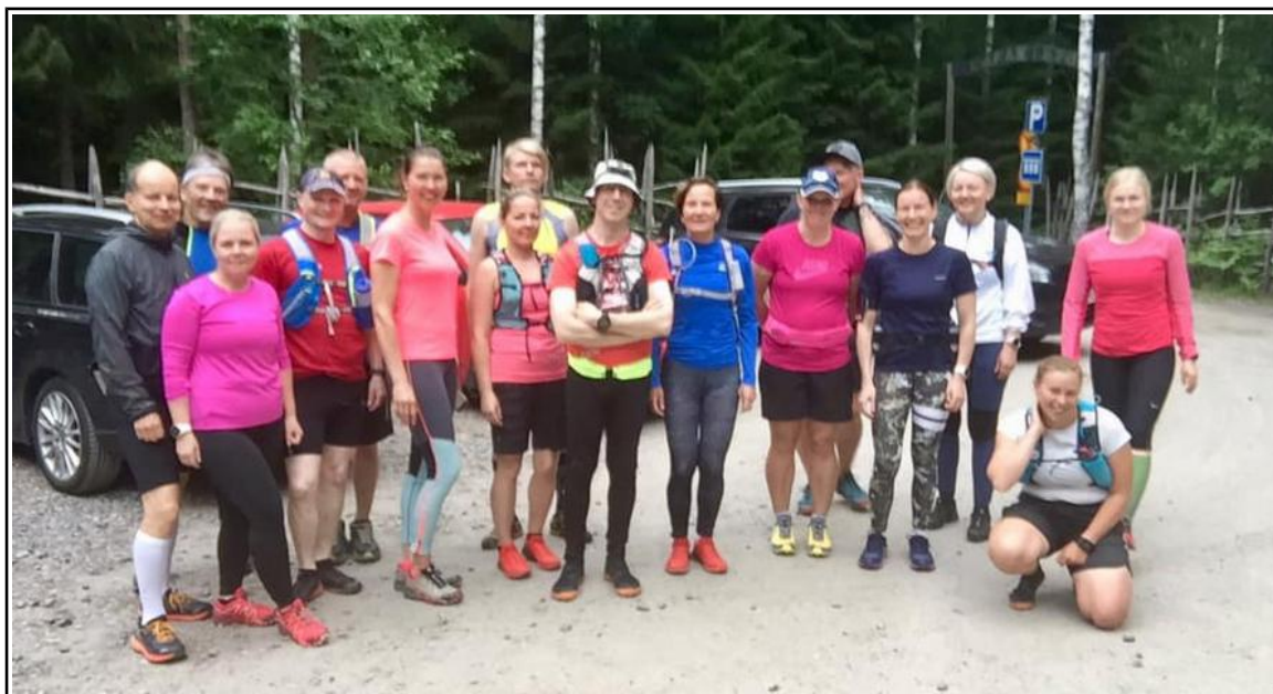
Polkujuoksijat lenkille lähdössä