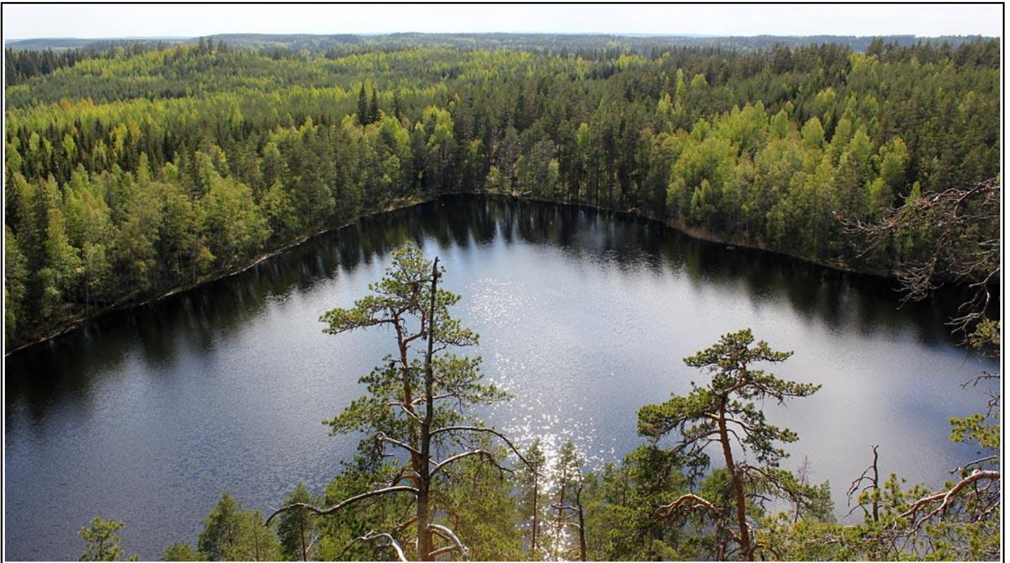
Olhavan vuori Kolmiolahti