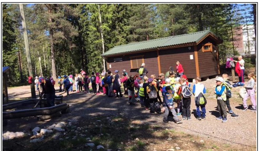
Salpakankaan eskarilaisia Tiiristuvalla