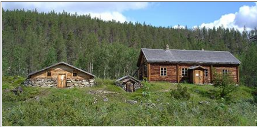
Ivalojoen Kultala, (kuva Pasi Nivasalo, luontoon.fi)

Mäntymetsät ovat Hammastunturin erämaa-alueella luonteenomaisia. Metsäpalot ovat muokanneet metsäkuvaa erityisesti 1700-luvulla, minkä seurauksena noin 250-vuotiaat tasaikäiset metsät ovat tavallisia. Ivalojoen eteläpuolella levittäytyy aapasoiden alue, joka on vaikuttava soiden ja kankaiden mosaiikki. Poroille aapasuot ovat merkittäviä kesälaidunalueita, mutta retkeilijälle alue on kesäaikaan vaikeakulkuinen.